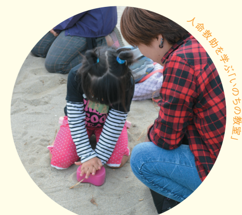
人命救助犬と家族の笑顔

本財団「海と日本プロジェクト」の活動の一環として開催された家族対抗はだし運動会は7月31日の新潟会場を皮切りに全国4カ所で開催された。イベントは、地元の子で楽しませて汗をかき、家族愛を深めるために行う家族のためのプログラム。企画主旨について朝日理事長は「日本は島国であり、海に囲まれているビーチ大国。その環境を利用して家族で楽しむ運動会を通じて、ビーチを身近に感じ、海の大切さを再認識してほしい」と話す。