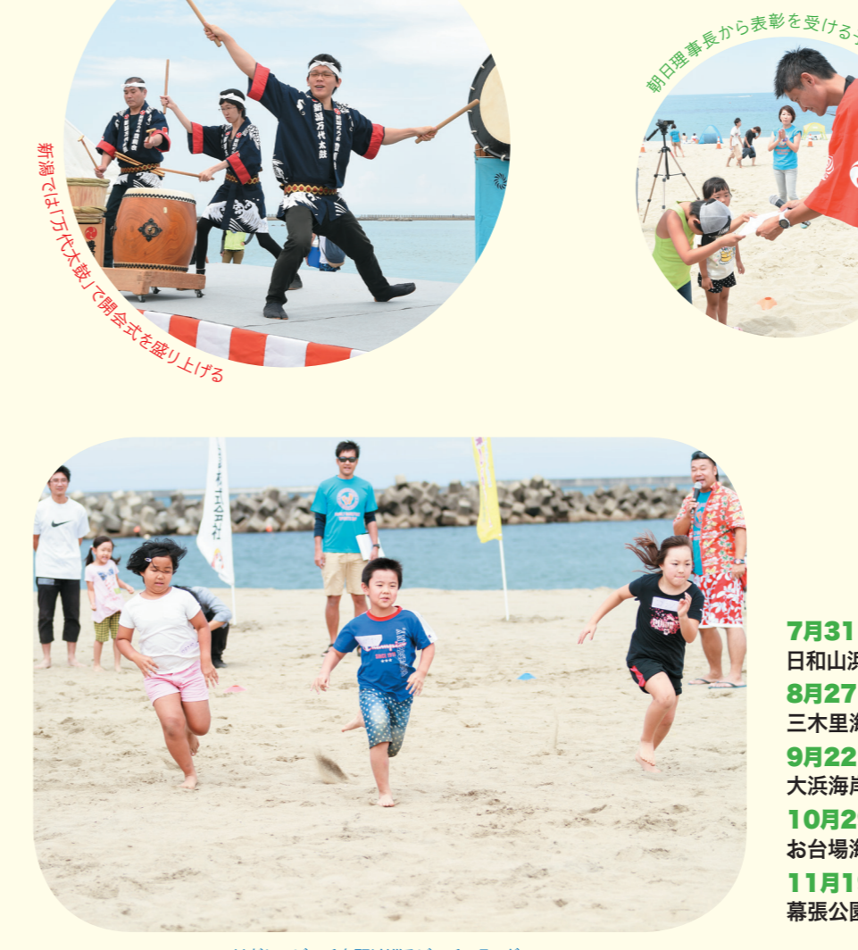
はだしでビーチを駆け巡るビーチフラッグス