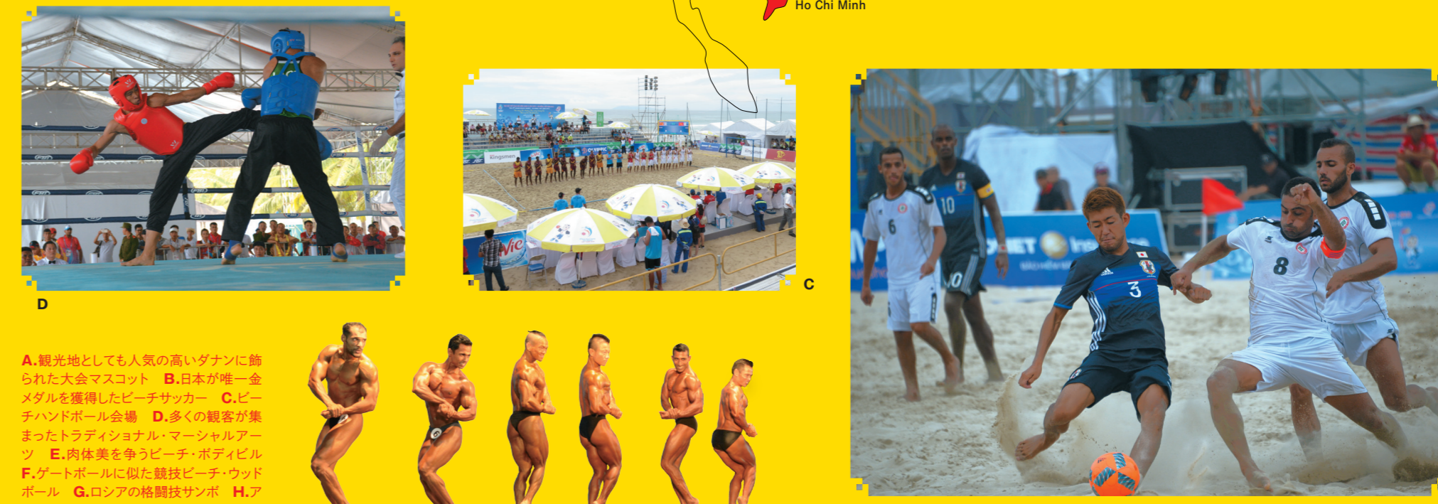
A.観光地としても人気の高いダナンに開かれた大会マスコット B.日本が唯一金メダルを獲得したビーチサッカー C.ビーチハンドボール会場 D.多くの観客が集まったドラゴンパレス E.肉体的なビーチ・ボディビル F.ゲートボールに似た競技ビーチウッドボール G.ロシアの格闘技サンボ H.アジアでも人気の競技ビーチセパタクロー