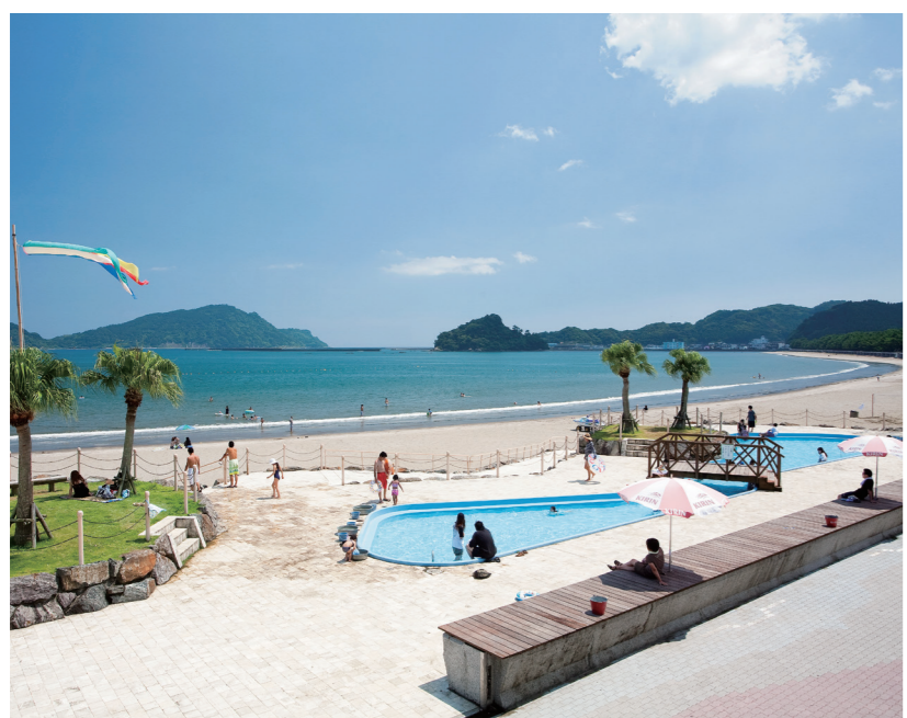
コバルトブルーの海が広がる大堂津海水浴場

チームはインドアのハンドボールより3人少ない4人制、約半分の広さのコートで試合を行い、選手はいつでも交代ができる。ビーチハンドボールを参考に考えられたため、娯楽性が高く、スカイプレー(空中でパスを受けそのままシュート)、ビル