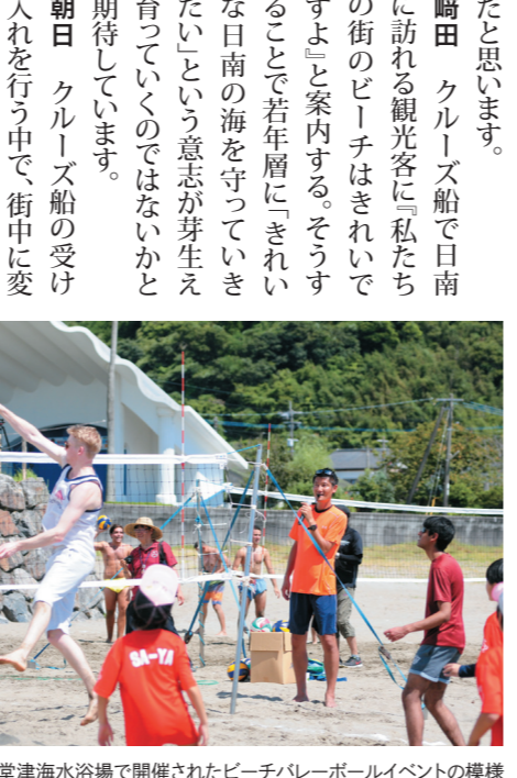
2016年8月に大堂海水浴場で開催されたビーチバレーボールイベントの様

と意気投合していました。崎田 大堂海水浴場は、海水の透明度も高く、地元をはじめ県内外の方々からも人気があります。以前は外国人の方が多いという発想が、ある程度は消えていきました。今では、寄港地での観光とビーチ・アクティビティの両方を提供できています。